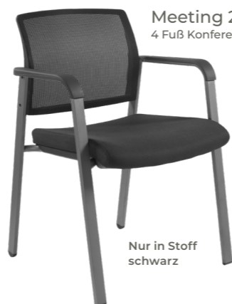
Nur in Stoff schwarz