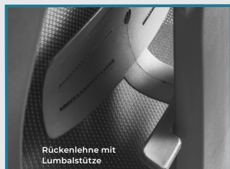
Rückenlehne mit Lumbalstütze